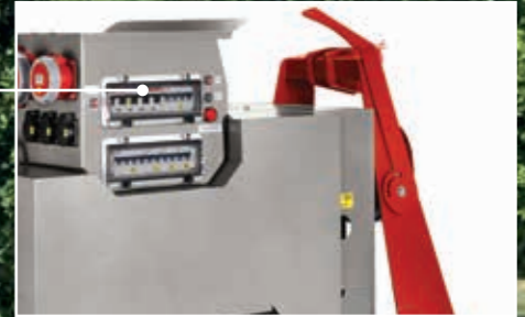
Einspeisesteckdose CEE 400V 7h