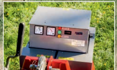
Anzeigen vom Traktor aus gesehen